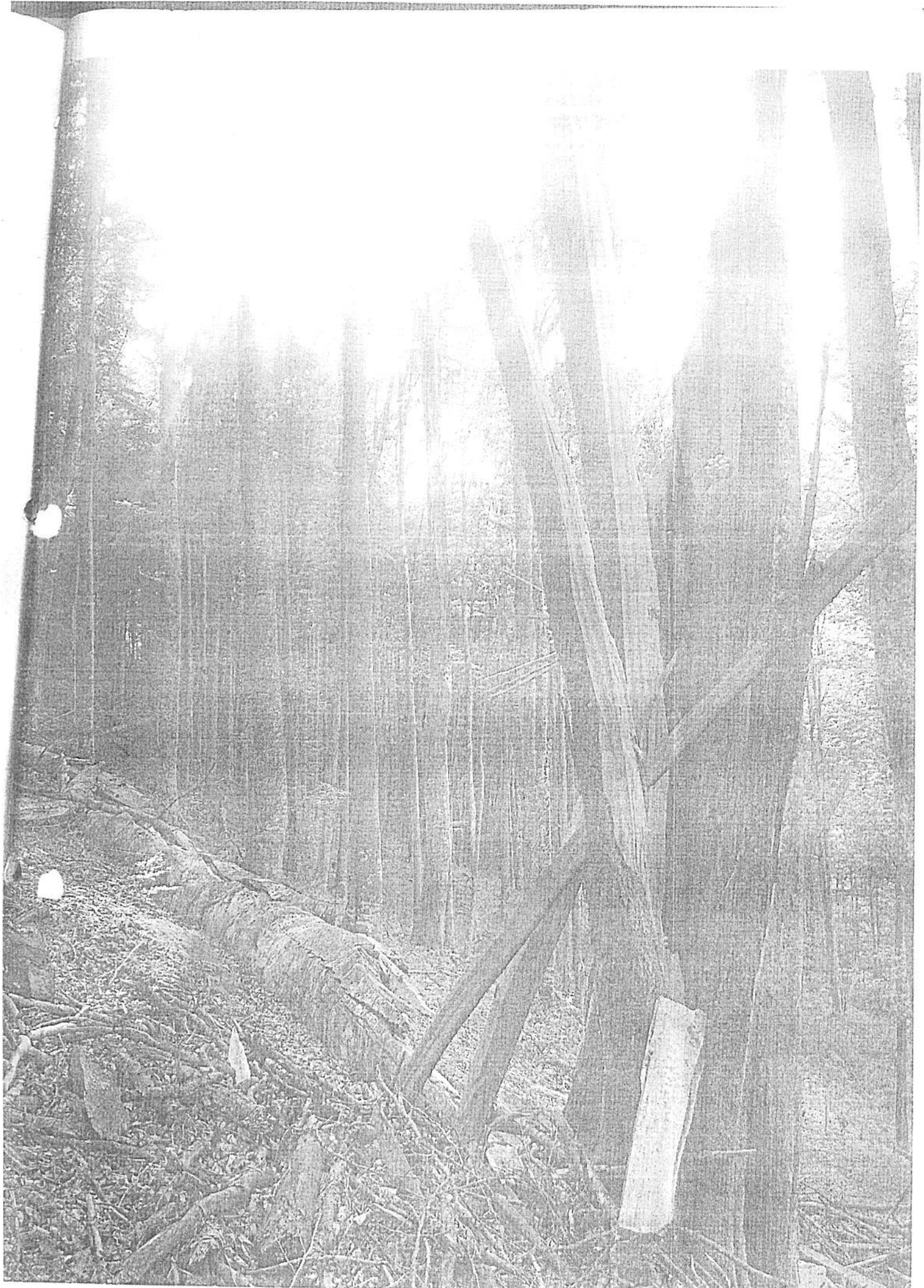
Photograph by Gen. Grant Under