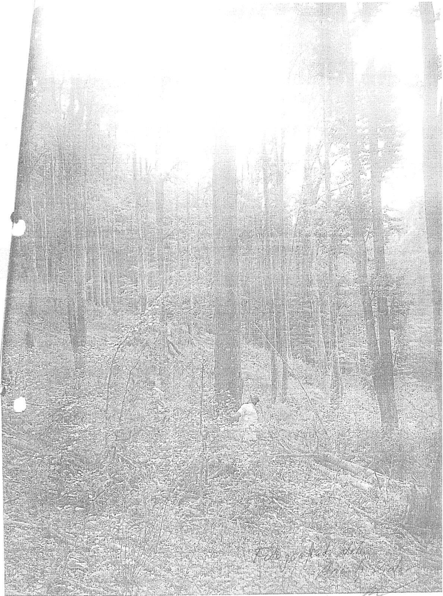
Photo of the author in the forest